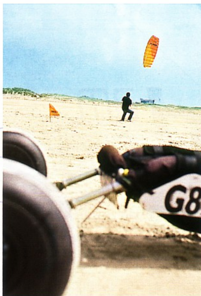
Wer zieht hier wen? Erste Lenkversuche hinterlassen ihre Spuren im Sand ...