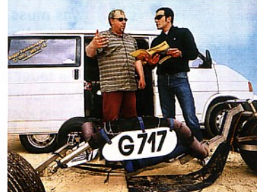
Alles im Griff: Auf die triste Theorie folgt der schnelle Spaß auf dem harten Strand