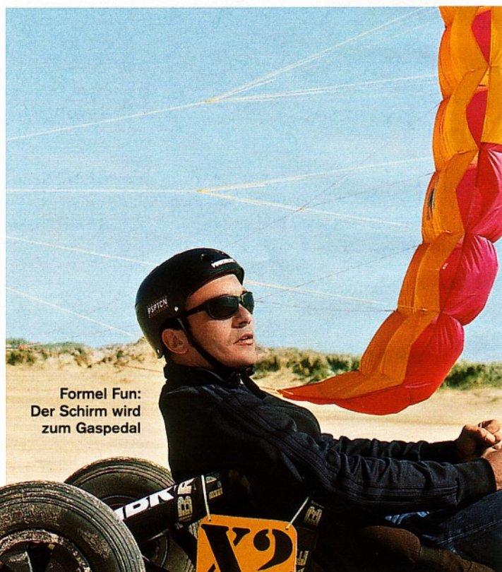
Formel Fun: Der Schirm wird zum Gaspedal

Kitebuggy-Fahrschule, Tel. 0170/3 83 27 48, www.buggyfahrschule.de ; Windsurfing Borkum, Tel. 04922/22 99. Allg. Infos: www.gpa.de