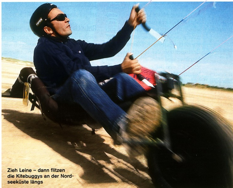
Zieh Leine – dann flitzen die Kitebuggys an der Nordseeküste längs

Ein Gefühl wie sonst nur auf der Kartbahn: Im Kitebuggy düsen Sie im Höllentempo über den Sand . Doch statt mit Benzin wird hier mit der Kraft des Windes gespielt!