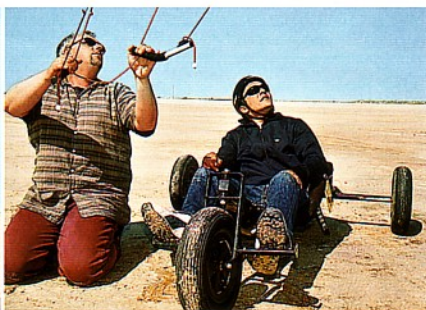
Steiles Gefährt: Skeptisch folgen die Blicke dem zappelnden Kite

doch liegt das Fahrrevier in einem Naturschutzgebiet, weshalb hier eine Lizenz notwendig ist. Die Prüfung nimmt vor Ort eine Kitebuggy-Fahrschule ab. Bei Höchstgeschwindigkeiten bis zu 100 Kilometer pro Stunde kann es nicht schaden, Vorfahrtregeln, Bremsen und Ausweichmanöver zu